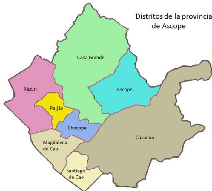
FIGURA N° 01 DISTRITO DE LA PROVINCIA DE ASCOPE